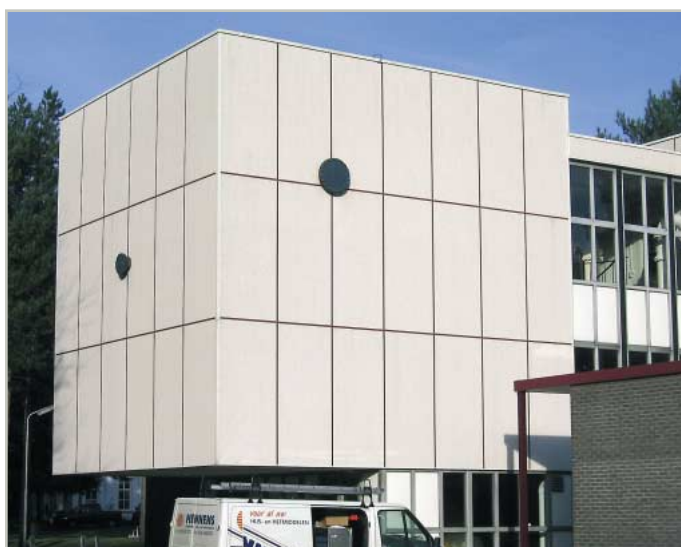
санация бетонного здания, Нидерланды

При производстве фасадных систем Винилит опирается на более чем 30-летний опыт. Фасадные панели производятся с помощью новейших технологий из надёжных и долговечных материалов. Гарантия качества материалов обеспечивается благодаря непрерывному внутреннему контролю качества, а также периодическому стороннему контролю со стороны Института по испытанию материалов в Лейпциге. vinylTherm система полной защиты фасадов разрешена к применению Немецким Институтом строительной техники в соответствии с допуском технического надзора Z-56.277-943 и соответствует ДИН 4102-B1 и ДИН 18516 часть 1.