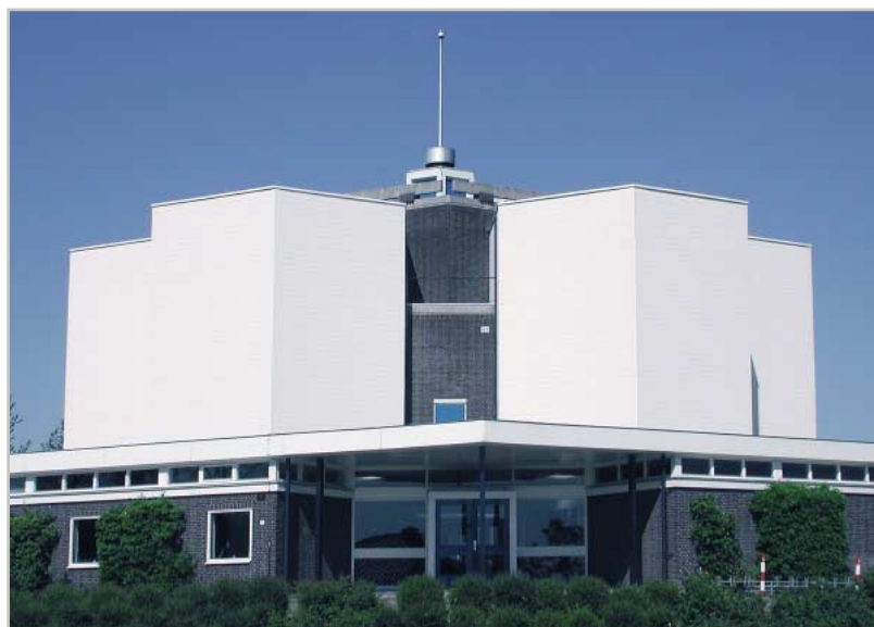
водонапорная станция Лимшотен, Нидерланды