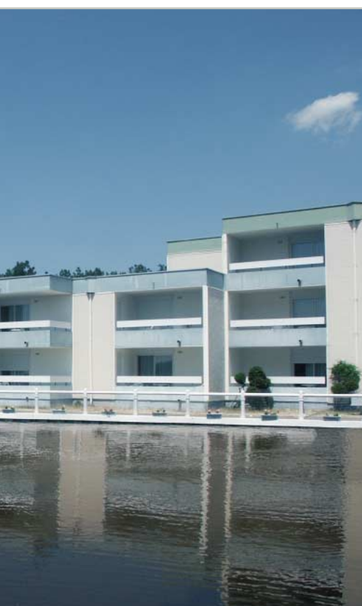
дом отдыха в Лакану, Франция