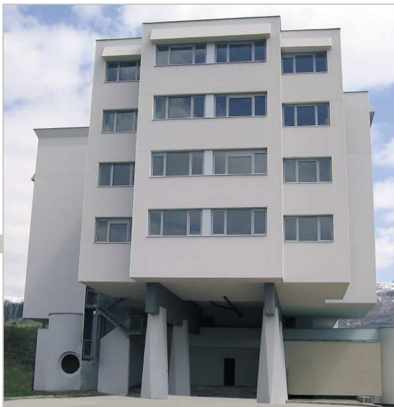
больница в Сараево