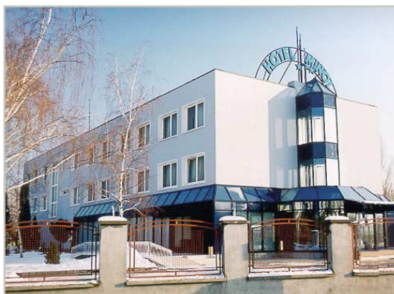
гостиница Минол в Будапеште, Венгрия