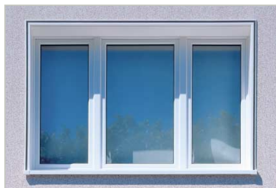
окно с оконным откосом виниКом

Винилит предлагает полный набор аксессуаров для решения деталей фасада. К ним относятся система отделки оконных и дверных откосов, Соединительные профили, профили для отделки углов, нижнего и верхнего края фасада. Все дополнительные профили сконструированы так, что всегда обеспечивают вентиляцию фасада.