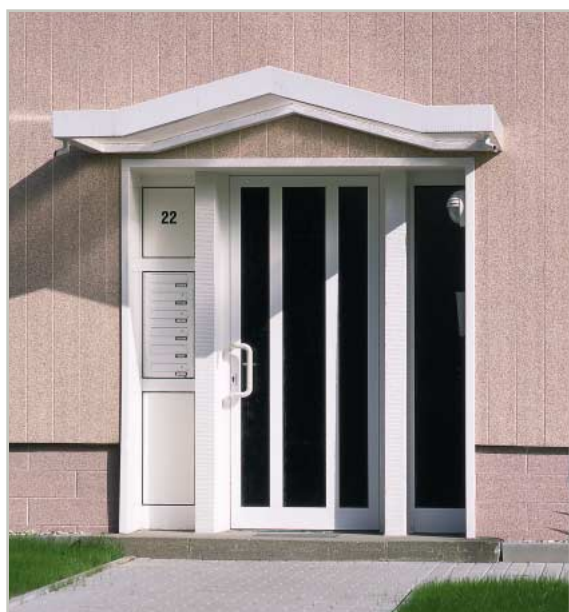
С помощью системы отделки откосов виниКом окна и двери обрамляются точно по размеру