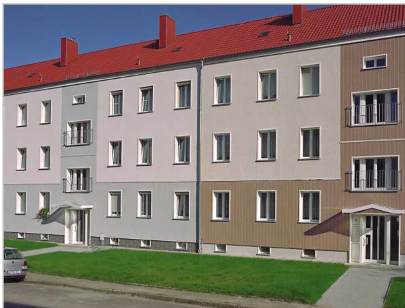
Жилой дом в г. Гёрлиц, Германия

По Вашему желанию мы отправим Вам информационную папку с образцами материалов и цветовой гаммой. Позвоните нам и мы с удовольствием проконсультируем Вас!