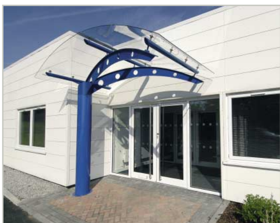
здание фирмы Бёрнли, Великобритания