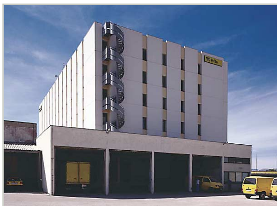
Почтовый терминал Сплит, Хорватия