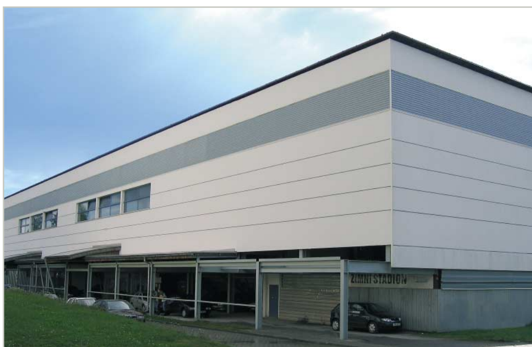
ледяной дворец в Бланско, Чехия