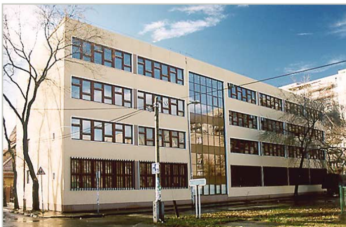
гимназия в Будапеште

Исследования показали, что в зависимости от стены можно сэкономить до 85% расходов на отопление. vinylTherm фасады, таким образом, отвечают жёстким требованиям новых Постановлений об экономии энергии по показателю приведённого сопротивления теплопередаче.