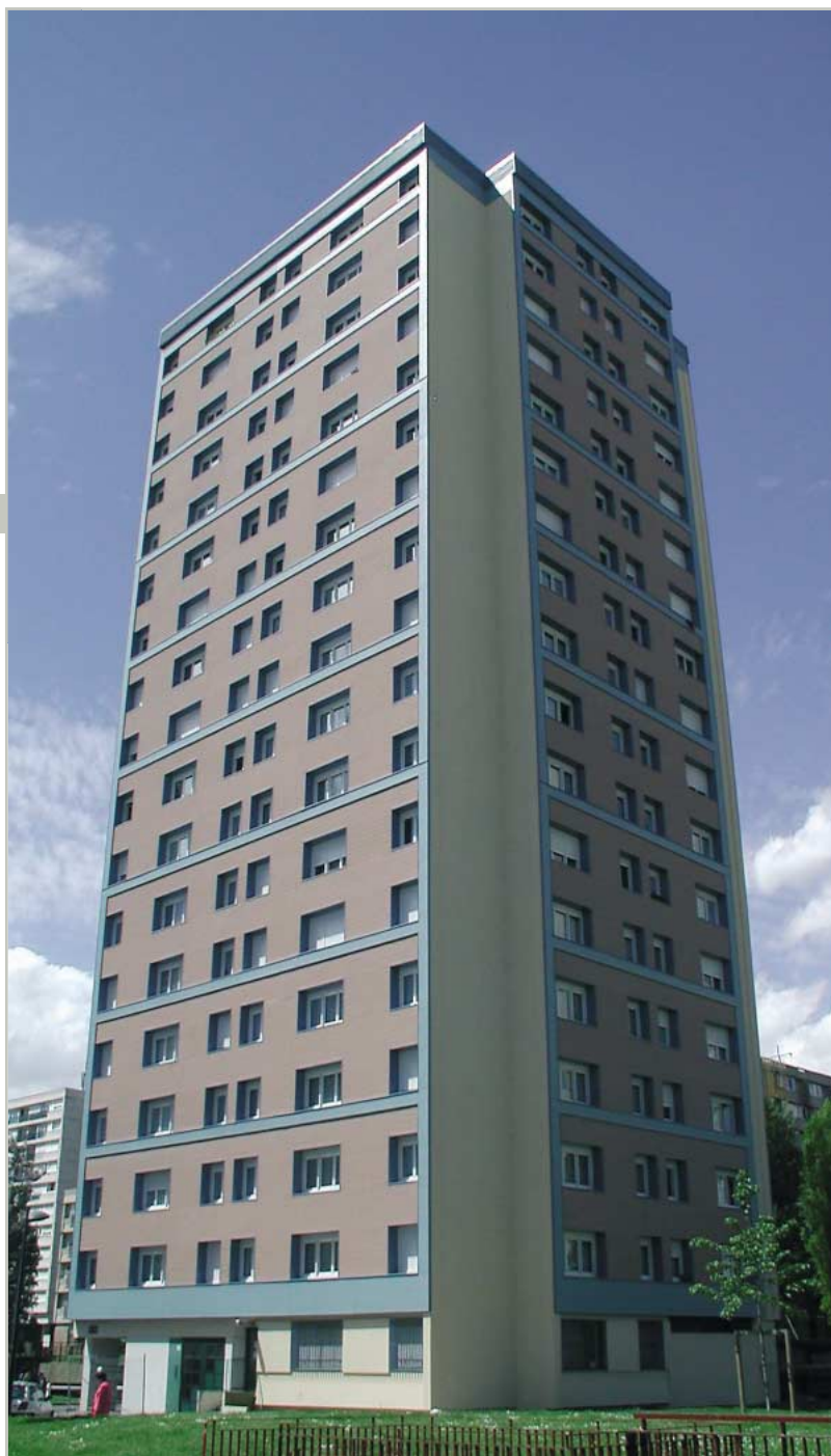
высотное здание в Париже, Франция

vinylTherm фасады можно заказать во многих красивых цветах. Спрашивайте у нас актуальную цветовую гамму.