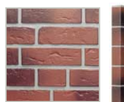
Рустика, красный кирпич обожженный